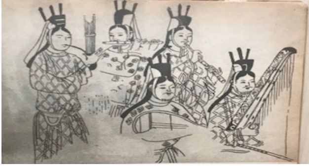
Şekil 4: Uyghur orkestrasını gösteren temsili bir gravür. Öndeki ud, Uzakdoğu kültür çevrelerinin pipa veya biwa denilen ünlü ududur 61 .