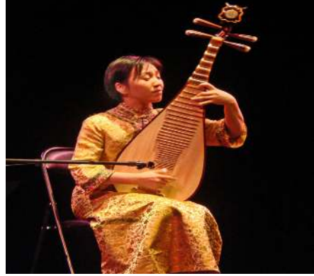
Şekil 7: Çin udu, pipa 68 .

Moğolca bir söz varlığında pi-pa için şöyle denir: 1. biba: dört veya altı telli bir çalgı, lavta, gitar; 2. pipa: Çin lavtası 67 . Bir Çin kaynağı ve bir “Uygur Efsanesi”nde, adları belirtilen kopuz çeşitleri arasında, pi-pa ile bir tutulması gereken bir kopuz tipinden söz edilir. Gövdesi ile sapı yek pare olan ve dıştan görünüşü şimdiki armudî kemençemize benzeyen bu pipa tipli kopuz ile daha sonraları ortaya çıkan ud arasında yapısal bir benzerlik olduğu düşünülmektedir 68 . Afganistan Kandahar’ının taş üzerine Greko-Budik kabartmalarında, “Kandaharva” denilen ilk münzevi Hint musikicilerinin betimlendiği sazende resimlerinden birinde, bir sazendenin kucağında çaldığı barbat tipli udun pipa tipli kopuza benzediği görülmüştür 69 . Orta Asya’nın pipa kopuzu ile yakın akraba sayılabilecek olan ud, diğer yaygın