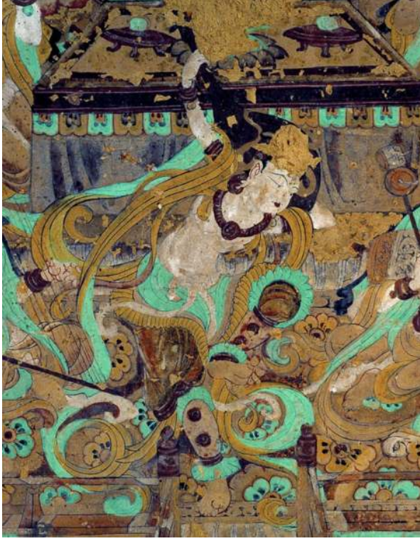
Şekil 3: Mogao Mağarası'nda arkasından pipa çalan bir dansçının veya apsaranın detayı. 112, güney duvarı, Dunhuang, Gansu 56 .

Çin'in günümüz Shanxi eyaletinin Anxi şehrinin batısında yapılan arkeolojik kazılarda ele geçen ve Kaiyuan öncesi döneme ait olduğu tahmin edilen üç renkli çömleklerde deve üzerine oturtulmuş insan figürleri ile kenarları örtülerle çevrilmiş bir örtü üzerinde sekiz kişilik bir orkestra yer almaktadır. Burada üzerlerinde "Hu" kıyafeti bulunan yedi erkek müzisyen, ellerinde "sheng, xiao, pipa, shuqin ve di" adı verilen müzik aletlerini tutar vaziyette betimlenmiştir 56 .