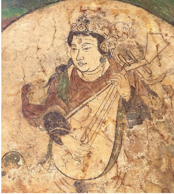
Şekil 10: Sincan, Kucha yakınlarındaki Qizil mağaralarında bulunan Tang dönemi (600-800) duvar resminden pipa icracısı. Dikey konumdaki pipanın çalınışında mızrapsız sağ el parmak itili kullanılmıştır 95 .

göre değişiklik göstermiştir. Nitekim, Xinjiang'daki Kucha yakınlarındaki Qizil mağaralarından birinde, duvarda pipa çalan bir sanatçının (Aspara) tasvirinde, pipanın dikey konumu ve sağ elin plektur (mızrap) olmadan parmak ile çalındığı görülmektedir. Bu durum, Tang dönemi için nadir olsa da sonraki yüzyıllarda norm haline gelmiştir. Nitekim Çin'in güneyindeki Fujian eyaletinden bir Çin klasik müzik tarzı olan "Nanguan Tarzına" göre, Nanguan pipa da gitar gibi boynu hafifçe baş aşağı bakacak şekilde tutulmuştur. Çalgının Qing Hanedanlığı (1644-1911) döneminde ise dikey veya düşmeye yakın bir pozisyon halini aldığı bilinmektedir. 94