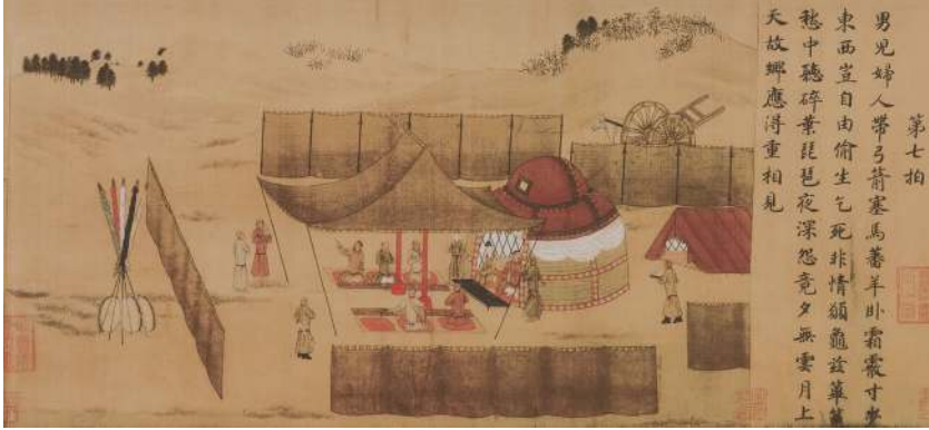
Şekil 2: Hun beyi ve Çinli elçinin Hun orkestrasından müzik dinledikleri ve görevlilerin de yemek servisi yaptıkları görülmektedir 27 .