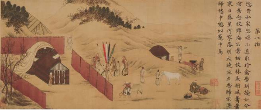
Şekil 1: Ts'ai Wen Chi'nin çizdiği bu resimde Hun otağında dört davul ve dört üflemeli çalgıdan oluşan tuğ takımı bulunuyor.

da Çin'e girmiştir. İmparator Han-Ling-Di, neyi çok beğenmiş, Ban-Chao, yürüyüşte burga kullanmıştır. Sai-Wen-Chi de Buriyada 18 melodi adlı bir manzum eser yazmış ve aynı musikiyi Hun Burgası ile çalmıştır 27 . Askerî müttefik aramak amacıyla Orta Asya'ya gelen Çin elçisi Chang-Chien, Kumul ilinde yaygın olan "Mahadur Mukamı"nı Çin'e götürmüş ve Han (Hen) devletinin musiki sarayından sorumlu müzisyen Li-Yuan, ona dayanarak 28 çeşit musiki icat etmiştir. 4-6. yüzyıllar arasında Çinlilerin Türk musikisine olan ilgilerinin artması sonucu Küsen (Kuça) ve Suli Kaşkar nağmeleri ile Hunların bir kolu olan Yabbanların "Davul Dans Musikisi" Çin'e yayılmıştır 28 .