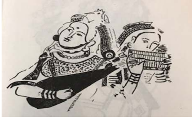
Şekil 5: Uyghur udu ve ağız müzikası. Bu ud veya pi-pa tipi, Doğu Türkistan'daki Türk Uyghur kültür çevresiyle ilgilidir 61 .