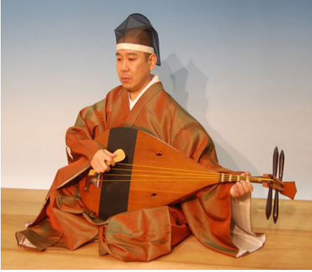
Şekil 6: Japon Udu, biwa 67 .

dedikleri müzik aletine Çinliler, “di”; Kırgızların “Tatar pipası” dedikleri müzik aletine Uygurlar “balıman/bi-li/pi-pi/Tatar borusu”, Çinliler “bi-li”; Uygurların “berbab” dedikleri müzik aletine Kök Türkler, Kırgızlar ve Çinliler “pipa” demektedirler 65 . Eberhard da flütün Çince karşılığı olarak “di” ve Tatar pipasının Çince karşılığı olarak da “bi-li” kelimelerini kullanmıştır 66 . Udun varlığı Çin’de “pipa”, Japonya’da “biwa” şeklindedir.